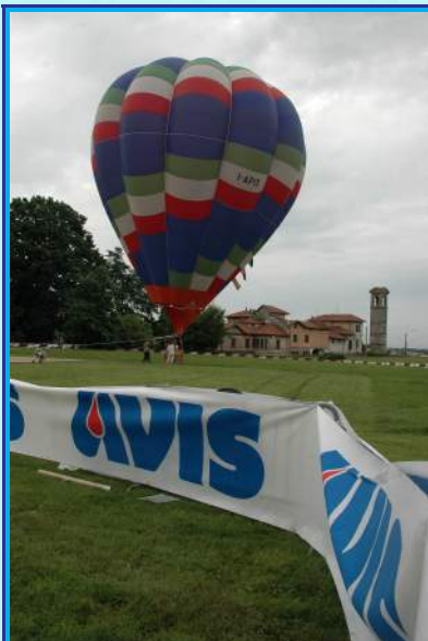
Mongolfiera con il Campanile di San Maurizio sullo sfondo