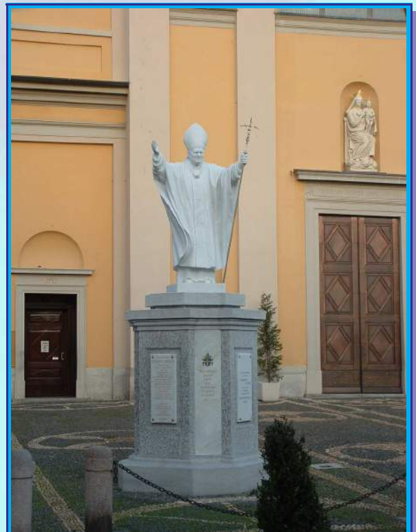
La statua di Papa Giovanni Paolo II sul sagrato della Chiesa di San Giulio