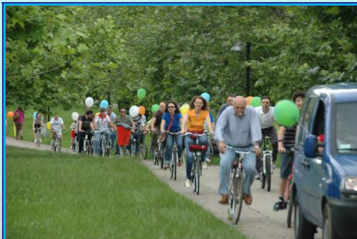
Bicicletta A.V.I.S. Cassano al Parco della Magana