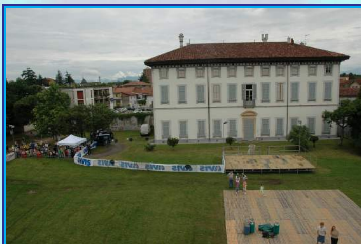
Villa Oliva vista dall'alto