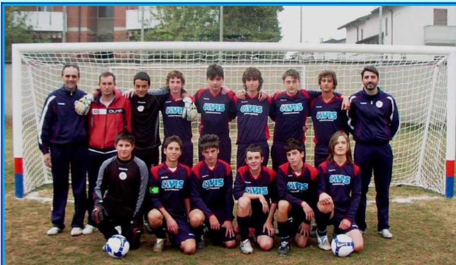
Formazione U15 del C.S.I. San Carlo con i colori A.V.I.S.