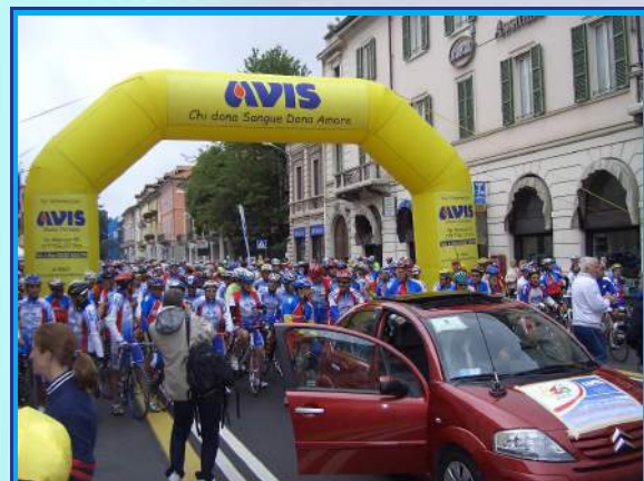
Partenza della Cicloturistica AVIS VARESE